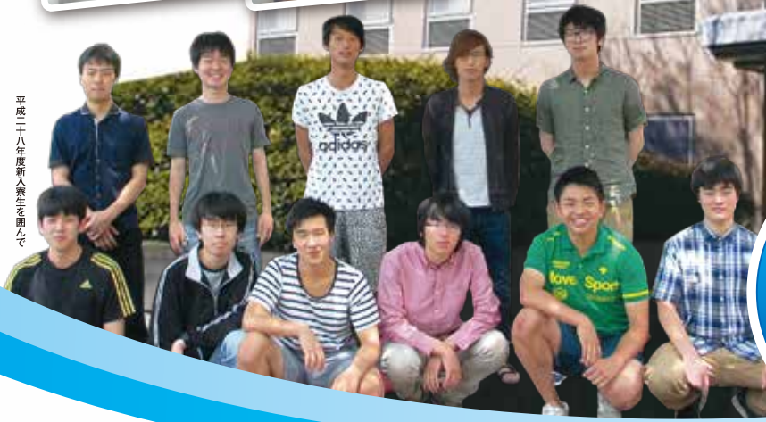
平成二十八年度新入寮生を囲んで