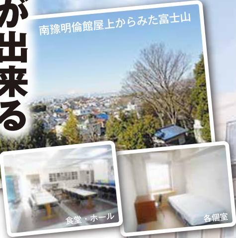
南豫明倫館屋上からみた富士山