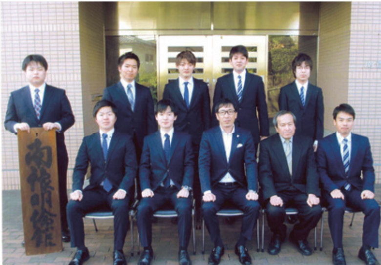
▲平成30年2月18日 卒寮生壮行会の前に撮影

平成30年3月、南豫明倫館を10人が意気揚々と巣立った。別れは毎年の恒例行事だが、思い出を胸に社会人として大いに活躍を期待している。旅立ちは、新しい出会いの始まりだ。2月18日には南豫奨学会が壮行会を開き卒寮生を激励した。後輩には「目標を持って全力を尽くせ」とあとを託した。