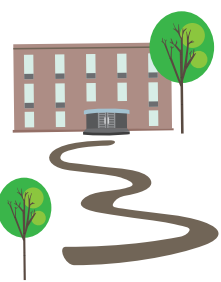
（平成30年6月1日現在）平成30年度在寮生 大学・出身高校一覧

最後になりますが、寮生一同を代表いたしまして、平日頃よりこの南豫明倫館を見守ってくださっている皆さまに心より感謝申し上げます。これからもどうぞよろしくお願ひいたします。